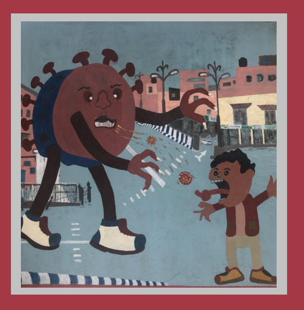
Anupam Trivedi District Jail, Pilibhit, Uttar Pradesh