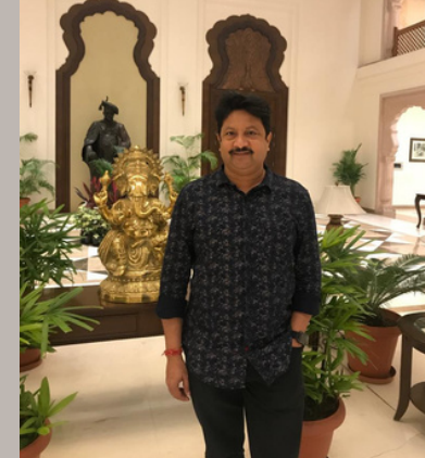
Montage Creator: Nitin Chowdhary

Tinka Tinka Jail News is the house magazine of Tinka Tinka Foundation- a Public Charitable Trust working towards reformation of inmates and bringing positive change in the prison environment.